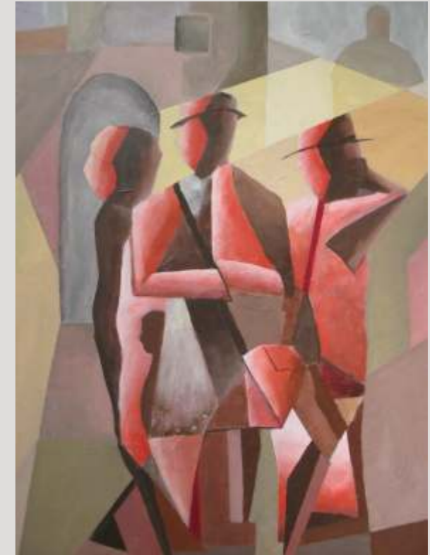
Ewald Seemayer: Die Touristen 70x50 cm, Acryl auf Leinwand

Gestaltung: Gerald Habicht, Freilassinger Kopierladen